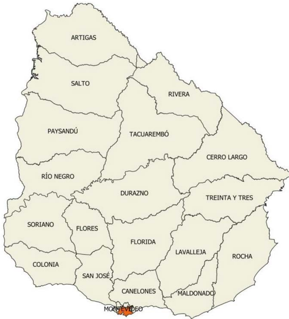
Figura 2. Remesa Urbana 01.

Los controles que se detallan a continuación fueron los aplicados a los productos entregados por la empresa productora para la Remesa Urbana 01