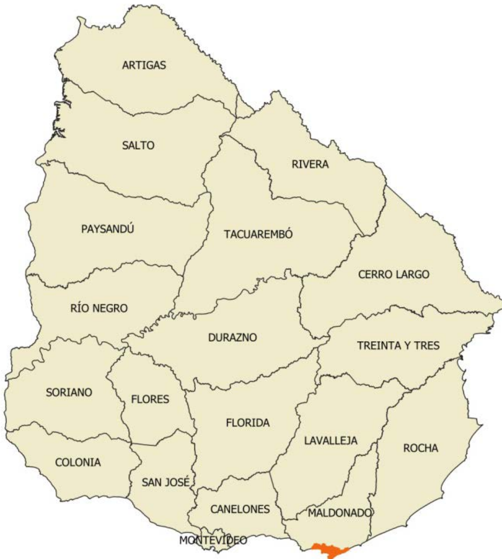
Figura 2. Remesa Urbana 02.

Los controles que se detallan a continuación fueron los aplicados a los productos entregados por la empresa productora para la Remesa Urbana 02