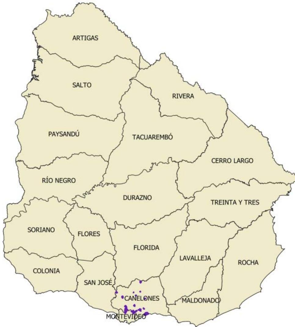
Figura 2. Remesa Urbana 04.

Los controles que se detallan a continuación fueron los aplicados a los productos entregados por la empresa productora para la Remesa Urbana 04