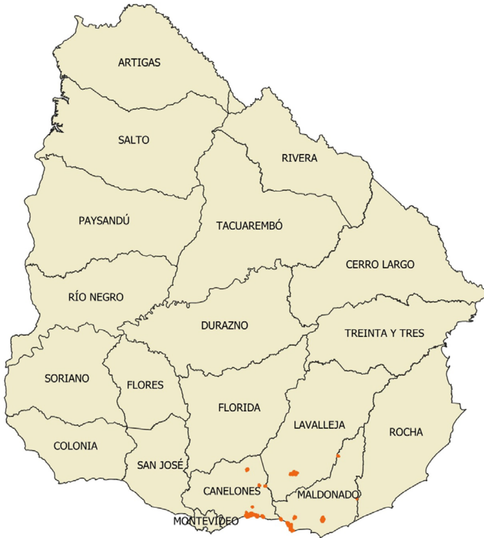
Figura 2. Remesa Urbana 05.

Los controles que se detallan a continuación fueron los aplicados a los productos entregados por la empresa productora para la Remesa Urbana 05