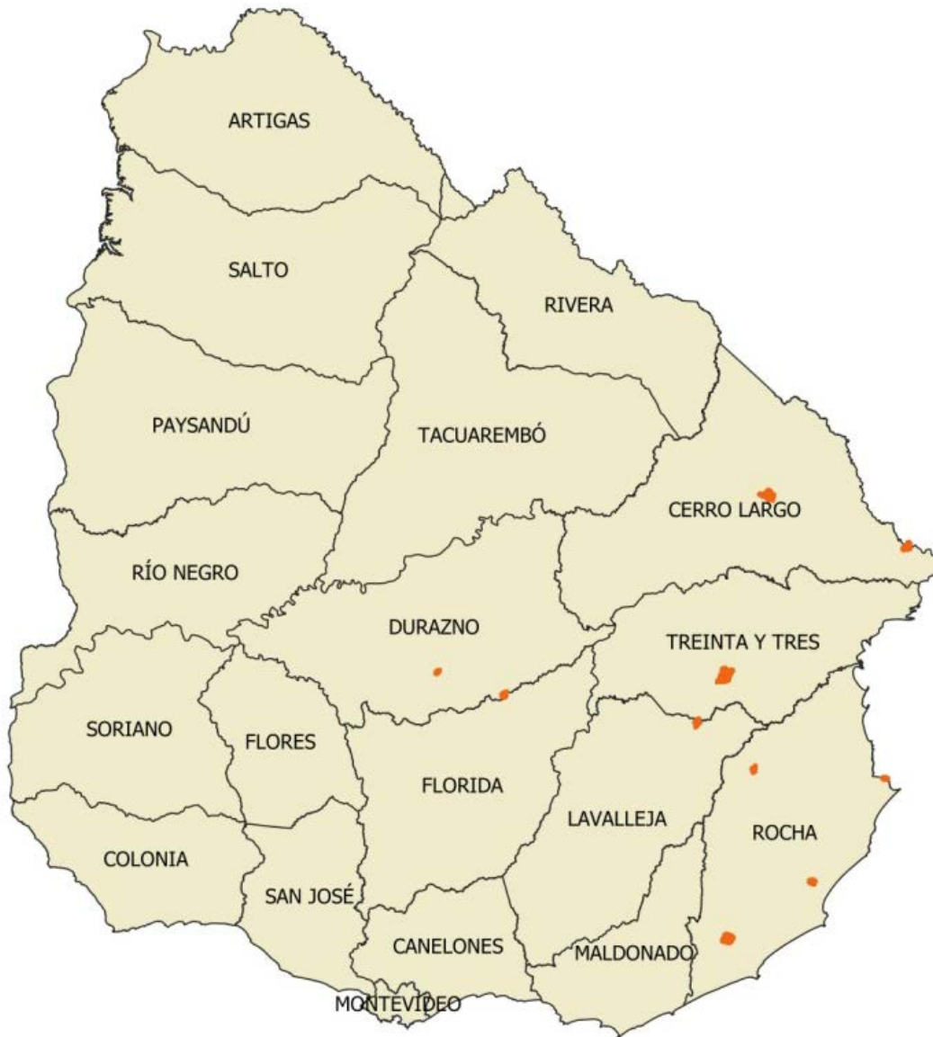
Figura 2. Remesa Urbana 06.

Los controles que se detallan a continuación fueron los aplicados a los productos entregados por la empresa productora para la Remesa Urbana 06