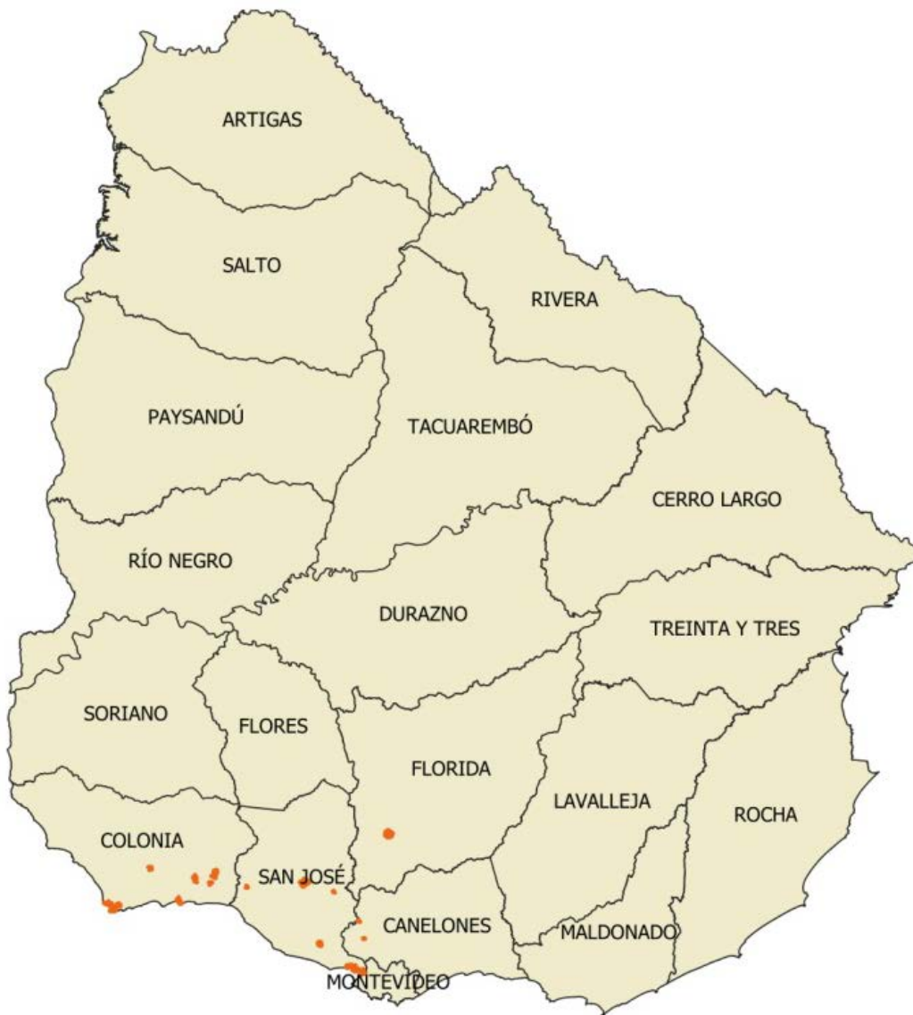
Figura 2. Remesa Urbana 07.

Los controles que se detallan a continuación fueron los aplicados a los productos entregados por la empresa productora para la Remesa Urbana 07