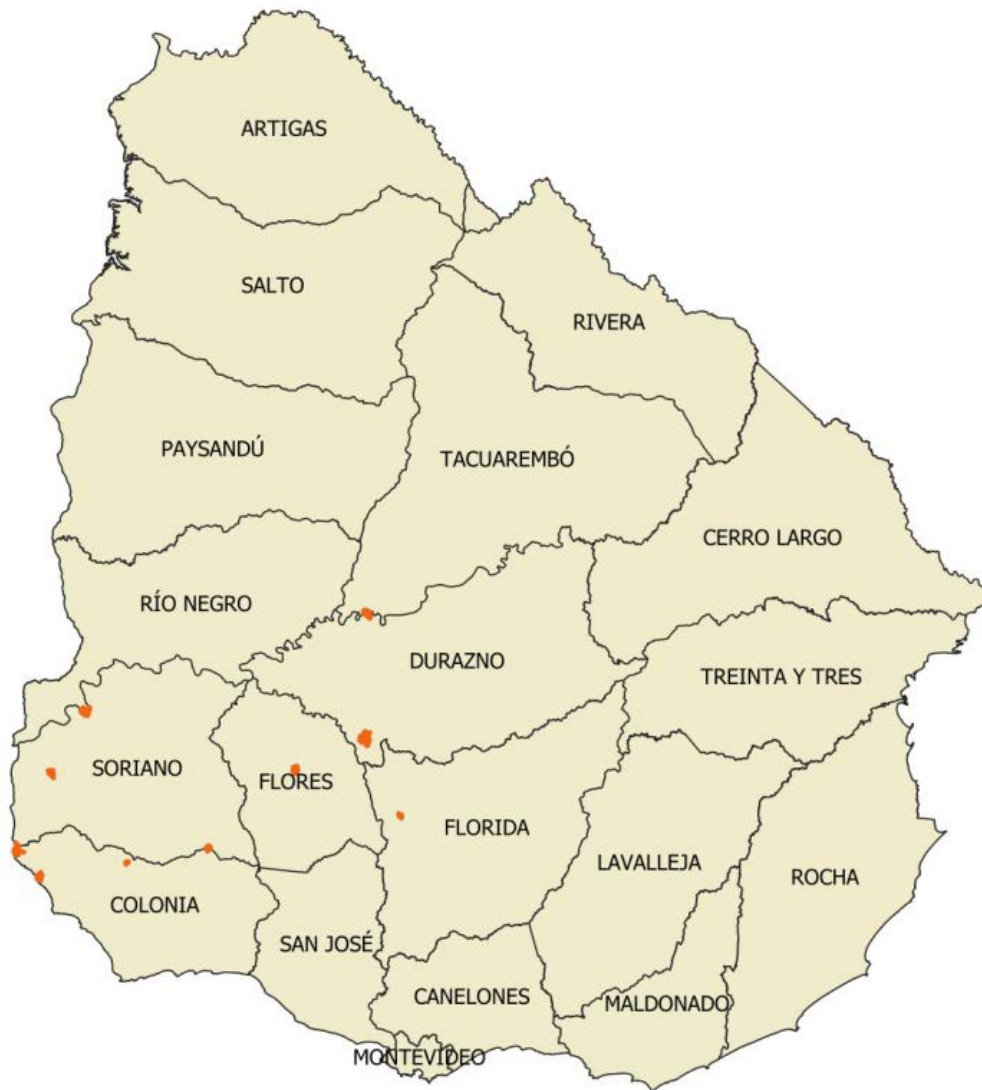
Figura 2. Remesa Urbana 08. Fuente: Plan de trabajo Topocart-AT

Los controles que se detallan a continuación fueron los aplicados a los productos entregados por la empresa productora para la Remesa Urbana 08