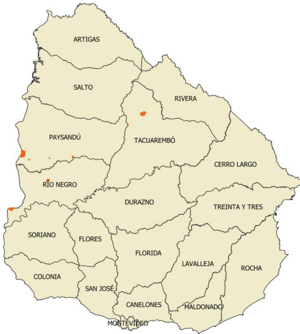
Figura 2. Remesa Urbana 09.

Los controles que se detallan a continuación fueron los aplicados a los productos entregados por la empresa productora para la Remesa Urbana 09